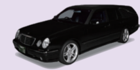
⑬霊柩車 ※ベンツAMG (八事斎場まで)