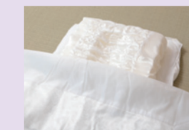
⑮お布団(高級宅送布団)