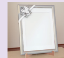
⑥遺影写真 (カラー四つ切)